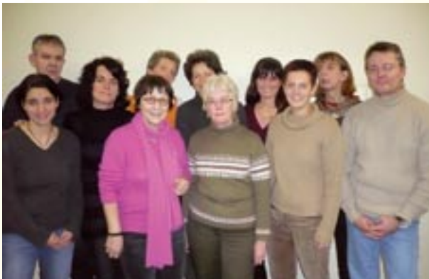
(Abb. Mitarbeiter, Halma e.V.)