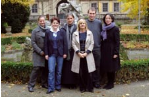
(Abb. hauptamtliche Mitarbeiter, Stiftung Juliusspital)

Unserem Leitbild entsprechend legen wir besonderen Wert auf eine individuelle Betreuung unter Berücksichtigung der jeweiligen Lern- und Lebensbiographie.